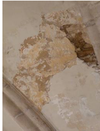
La voûte actuellement