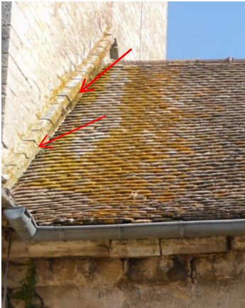
Diagnostic sur les infiltrations

Depuis l'automne 2017 des infiltrations entraînent la détérioration de la voûte du chœur. Elles ont augmenté au fil des mois, occasionnant des chutes de matériaux. Un membre de l'association a déterminé l'origine du problème, effectué le soutènement d'une poutre endommagée par l'eau en confectionnant un étrier métallique. A notre demande la municipalité a déclenché les travaux de maçonnerie assurant l'étanchéité de l'ensemble dans l'attente des travaux de restauration définitifs qui, on l'espère, débiteront 2019.